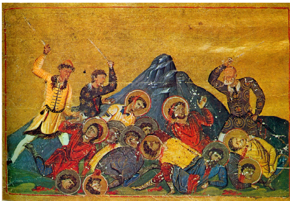
Обр. 5. Български воители в миниатюра от Менология на Василий II, около 1000 г., Ватиканска библиотека (Vat. gr. 1613) (по ИБ, т. 2, pass.).