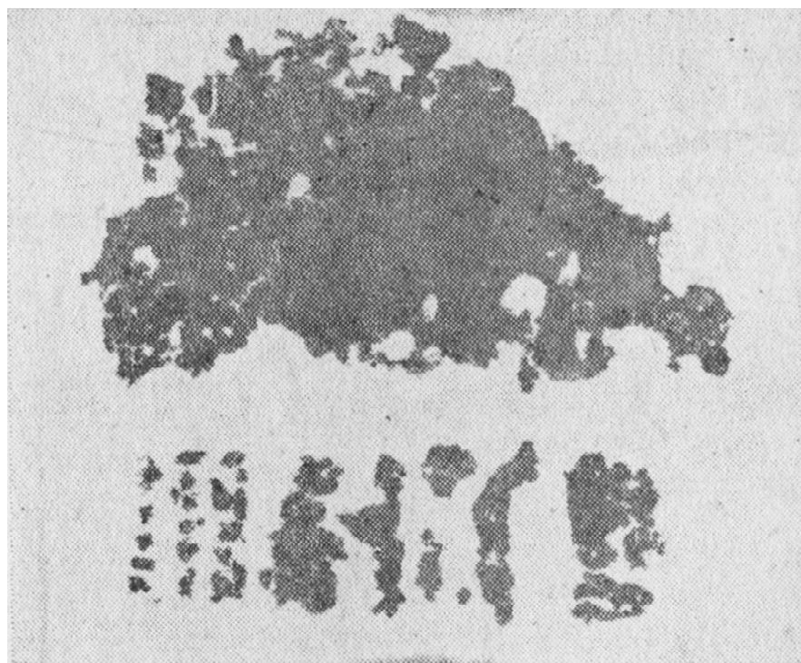
Обр. 2. Тъкан от саркофаг № 4 след консервация (по Малецки, М. 1976).