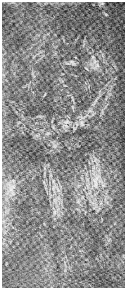
Обр. 1. Саркофаг № 4. Материалите на дъното на гробната камера (по Михайлов, С. 1979).