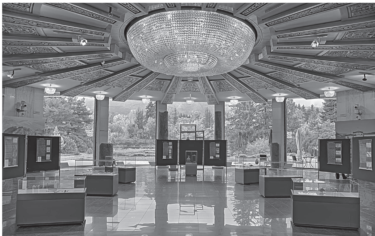
Обр. 3. Зала III – Изложбата „Аристократи и войни. Сребърните колани на българите“ с участието на РИМ – Шумен, АММИ – Раднево и НИМ.