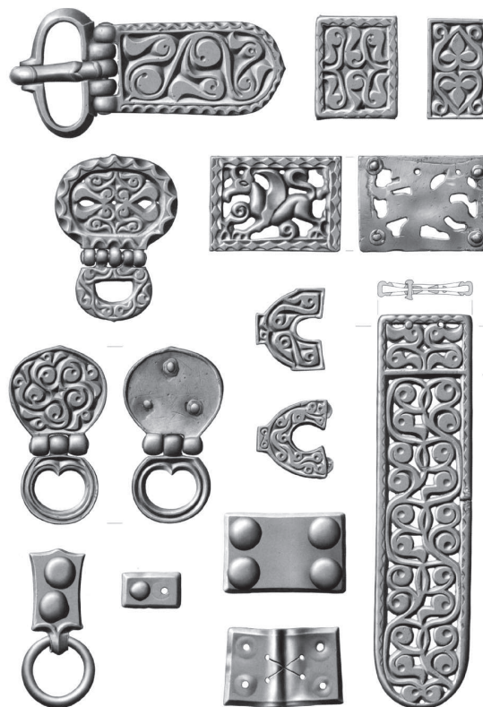
Обр. 2. Златни коланни обкови от съкровището от Врап, Албания (по Вернер, Й.).