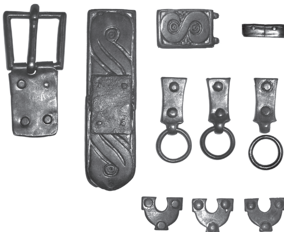
Обр. 4. Коланните обкови от колективния гроб в с. Гледачево, Старозагорско (по Даскалов, М., М. Тонкова).