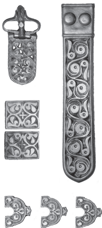
Обр. 1. Златни и сребърни обкови от съкровището от Ерсекe, Албания.